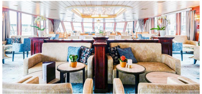
MS Aurora, Bar/Lounge

Kabine „Roulette“: Mit Erstellung der Reiseunterlagen wird eine Kabine nach dem Glücksprinzip (per Zufall) zugelost.