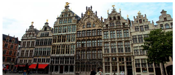
Brüssel, Grand Place