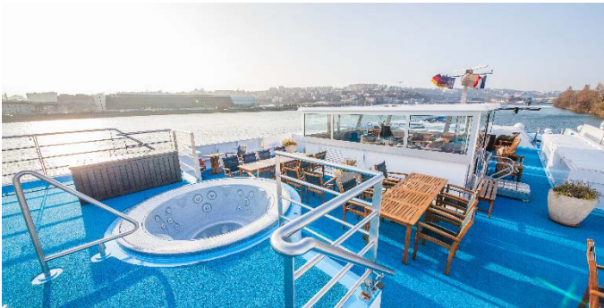
MS Klimt, Sonnendeck