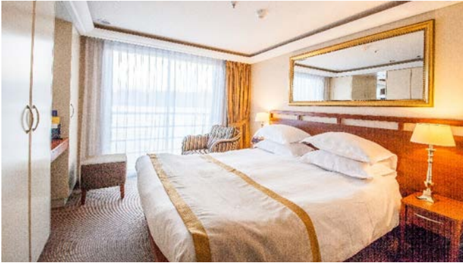
MS Klimt, Doppelkabine Cello- bzw. Violindeck